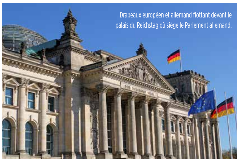
Drapeaux européen et allemand flottant devant le palais du Reichstag où siège le Parlement allemand.

« En quelques jours, Vladimir Poutine a réussi à faire ce que les alliés de l'OTAN ont passé des années à essayer d'obtenir : une augmentation massive des dépenses militaires de l'Allemagne. Il s'agit sans doute d'un des plus grands changements jamais observés dans la politique étrangère de l'Allemagne d'après-guerre. » 2