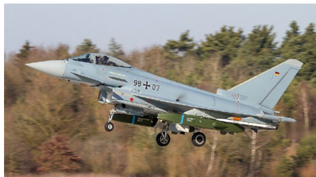
Eurofighter Typhoon d'essai allemand IPA7, équipé de missiles de croisière.

Fin 2018, l'Allemagne suspendait ses ventes d'armes à l'Arabie saoudite, suite au meurtre du journaliste Jamal Khashoggi qui aurait été commis par des agents du gouvernement saoudien. Mais l'attitude allemande à l'égard de l'Arabie saoudite est désormais plus favorable. Selon la ministre allemande des Affaires étrangères,